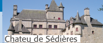
Chateau de Sédrières

Si le montant de la ligne « Impôt sur le revenu net avant correction » est inférieur ou égal à 61€ vous pouvez bénéficier de l'aide financière et le séjour vous reviendra à 208€.