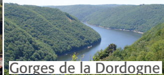
Gorges de la Dordogne